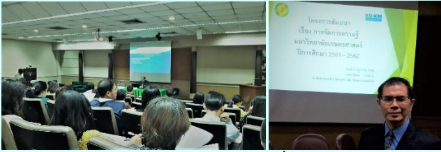
ภาพประกอบกิจกรรมที่ ๔