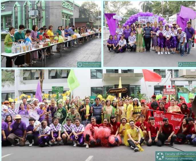
ภาพประกอบกิจกรรมที่ ๖