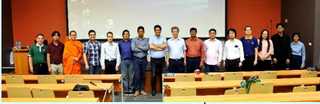
ภาพประกอบกิจกรรมที่ ๕