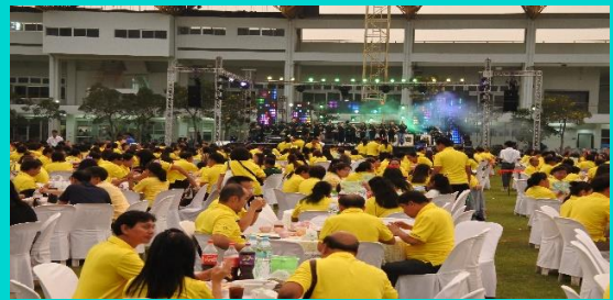
ภาพประกอบกิจกรรมที่ ๗

๗. วันศุกร์ที่ ๒๕ ธันวาคม พ.ศ. ๒๕๖๑ งานขอบคุณบุคลากรมหาวิทยาลัยเกษตรศาสตร์ ในช่วงเช้ามีพิธีทำบุญตักบาตรเนื่องในวันขึ้นปีใหม่ ช่วงบ่ายมีพิธีมอบโล่เชิดชูเกียรติและประกาศเกียรติคุณบุคลากร ในช่วงเย็นมีงานเลี้ยงขอบคุณบุคลากรประจำปี พ.ศ. ๒๕๖๑ ณ สนามรักบี้ มหาวิทยาลัยเกษตรศาสตร์ วิทยาเขตบางเขน