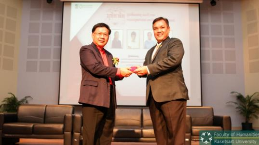
ภาพประกอบกิจกรรมที่ ๔