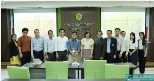
ภาพประกอบกิจกรรมที่ ๕