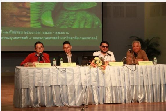
ภาพประกอบกิจกรรมที่ ๒

๓. วันอังคารที่ ๑๘ กันยายน พ.ศ. ๒๕๖๑ คณาจารย์ภาควิชาปรัชญาและศาสนาเข้าร่วมฟังการบรรยายทางวิชาการเรื่อง “คิด-เขียนอย่างไรให้ได้ทุนวิจัยไปอินเดีย” เวลา ๑๒.๓๐ - ๑๖.๐๐ น. ณ ห้องประชุม ๑ ชั้น ๓ อาคารมนุษยศาสตร์ ๒ จัดโดยฝ่ายวิจัยและนวัตกรรม คณะมนุษยศาสตร์