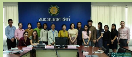
ภาพประกอบกิจกรรมที่ ๓