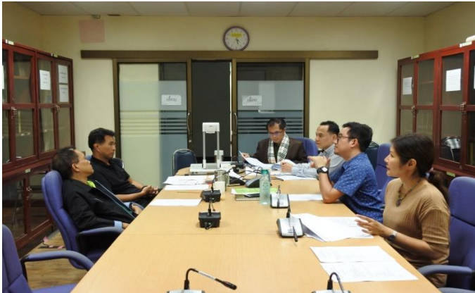
คณาจารย์ภาควิชาปรัชญาและศาสนาร่วมประชุมจัดทำตารางวิชาศิลปะการอยู่ร่วมกับผู้อื่นและรายวิชาปรัชญาสำหรับโลกยุคใหม่