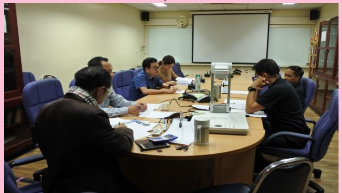
ภาพประกอบกิจกรรมที่ ๒

๒. วันพุธที่ ๒๐ กุมภาพันธ์ พ.ศ. ๒๕๖๒ คณาจารย์ภาควิชาปรัชญาและศาสนาร่วมประชุมเพื่อปรึกษากันในเบื้องต้นเกี่ยวกับการจัดทำตำรารายวิชา ๐๑๓๘๗๑๐๑ (ศิลปะการอยู่ร่วมกับผู้อื่น) และรายวิชา ๐๑๓๘๗๑๐๒ (ปรัชญาสำหรับโลกยุคใหม่)