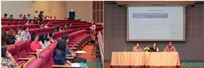
ภาพประกอบกิจกรรมที่ ๑