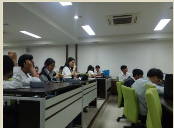
ภาพประกอบกิจกรรมที่ ๔