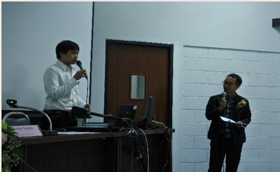
ภาพประกอบกิจกรรมที่ ๗