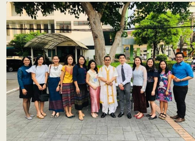
ภาพประกอบกิจกรรมที่ ๓