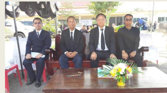
ภาพประกอบกิจกรรมที่ ๒

๔. วันศุกร์ที่ ๑๘ มกราคม พ.ศ. ๒๕๖๒ คณาจารย์ภาควิชาปรัชญาและศาสนา พร้อมทั้งนิสิตระดับปริญญาตรีของภาควิชาฯ เข้าร่วมในกิจกรรมโครงการมัชฌิมนิเทศ (นิสิตพบอาจารย์ที่ปรึกษา)