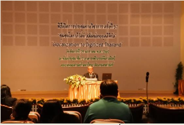
ภาพประกอบกิจกรรมที่ ๖